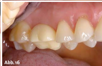
Abb. 13 und 14: Zirkoniumdioxid-Abutment – okklusale und vestibuläre Ansicht. – Abb. 15 und 16: Provisorische PMMA-Krone – okklusale und vestibuläre Ansicht.