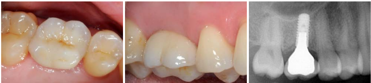
Abb. 20: Okklusale Ansicht der definitiven Versorgung. – Abb. 21: Vestibuläre Ansicht der definitiven Versorgung. – Abb. 22: OPG-Ausschnitt – 24 Monate nach Implantatinsertion.